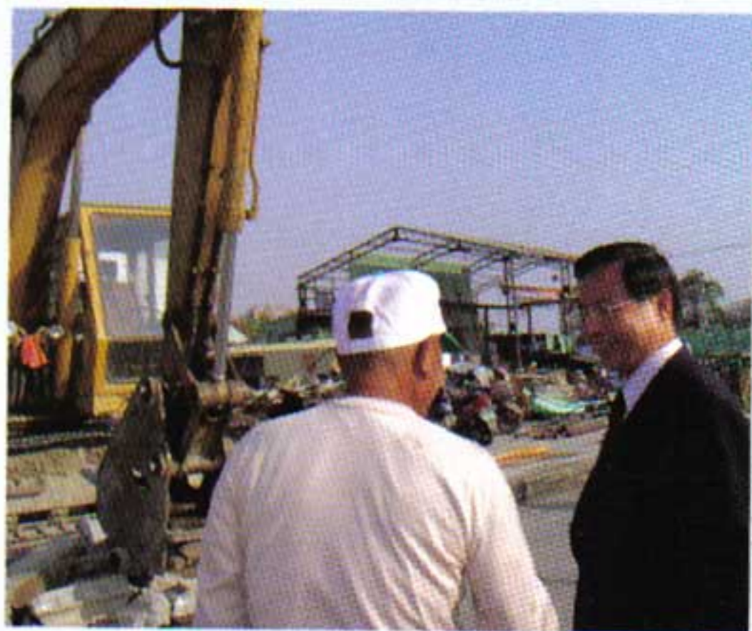
◎安平舢舨碼頭整治，市長前來了解漁民的需求。