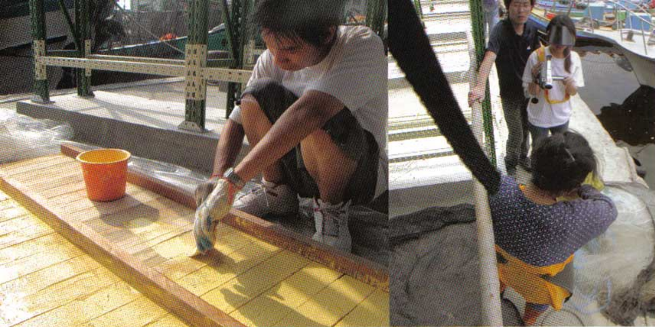
◎成功大學建築系及樹德科技大學學生參與漁具倉庫組合，有助實際了解理論外的人文環境。