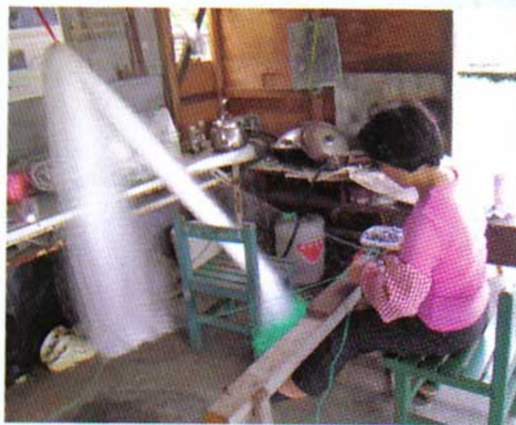
◎漁具倉庫是漁民工作的場所。