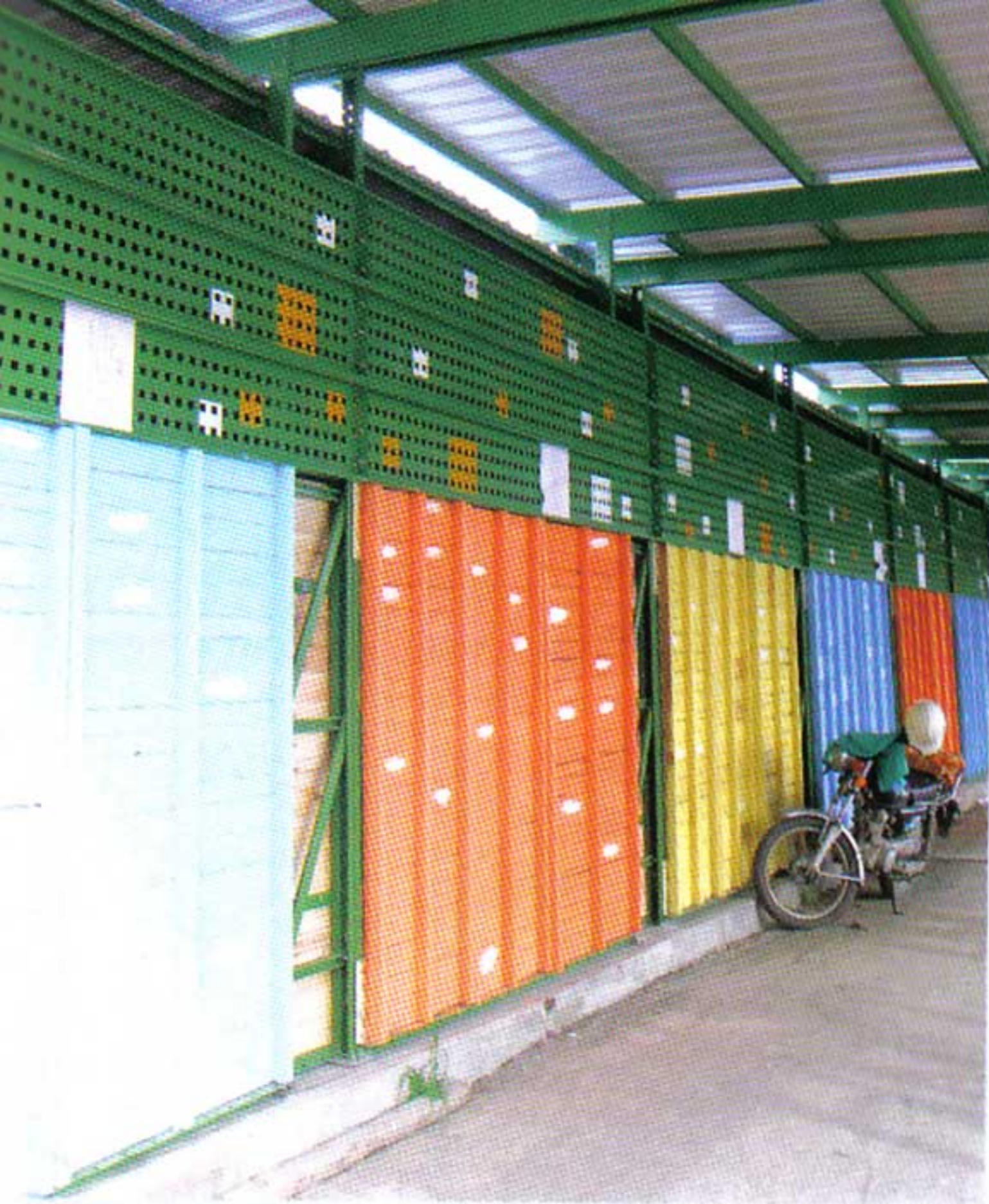
安平舢舨漁具倉庫著重機動組合可讓漁民自行調整。